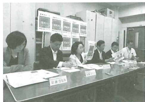
「これまで森林にあまり関係がなかった企業も巻きこんで、大きなうねりを巻き起こしていきたい」と話す米田委員長(左から3人目)。

*不正使用の例・マーク使用の許可を得ないで本マークを使用した場合・外材に対してこのマークを使用した場合など